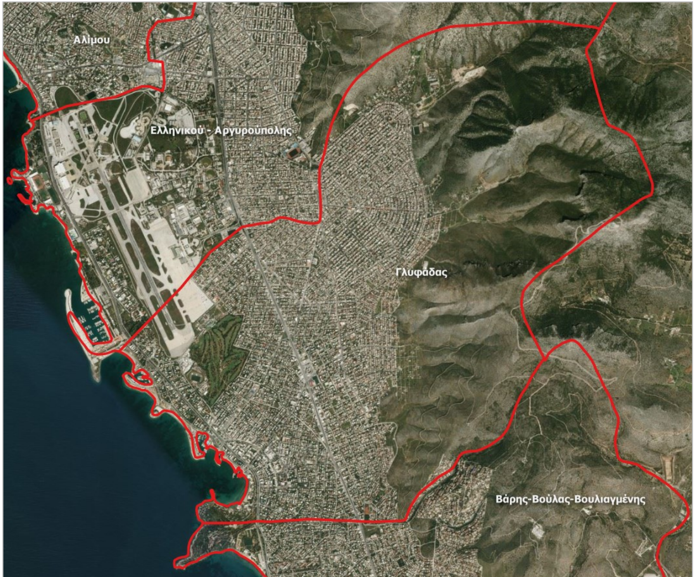
Εικόνα 3: Όριο Δήμου Γλυφάδας - Περιοχή μελέτης ΣΒΑΚ

Σύμφωνα με τα συμβατικά τεύχη, ως περιοχή μελέτης ορίζεται η γεωγραφική περιοχή που καλύπτει το σύνολο του Δήμου Γλυφάδας.